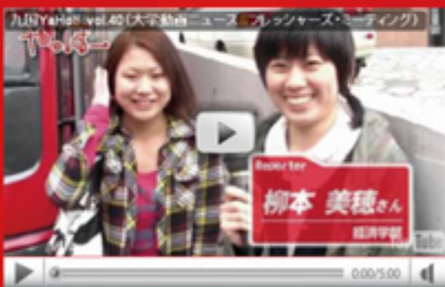
vol.40 「新入生宿泊研修 (経済学部)」 (平成 22 年 4 月 28 日配信)

大学キャンパス内で実験的に実施した学生企画「キャンパス逃走中！」(フジテレビ放映中)。学生自治のメンバーが企画した現代版「鬼ごっこ」ともいえるルールでは、30 名の大学生が逃走者とハンターに分かれて逃走劇を繰り広げます。最後まで逃げ延びた者は一体誰なのか? どうぞお楽しみください。