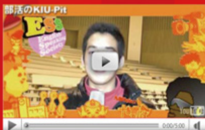
vol.35 「部活の KIU-Pit ESS 編」 (平成 22 年 1 月 27 日配信)

今年 2 月 3・4 日に開催された「学内合同企業面談会」超・就職氷河期といわれる 2010 年就職採用状況の中、九州国際大学内には 1 日に 50 社もの企業人事担当者の方々が大学面談会に参加してくださいました。静かな闘志を秘めて、熱い火花を散らせる九国大生たちの就職面談会をぜひご覧ください。