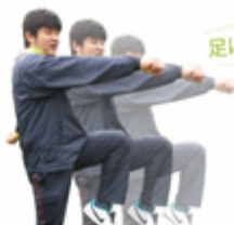
足は高く上げろー!

サプライズは、保護者の方々からの手紙…。照れくさそうに手紙を受け取った生徒も感動で眼を赤く染めた生徒も、心を込めて綴った返事は、親子の思い出として一生胸に刻まれるはず。