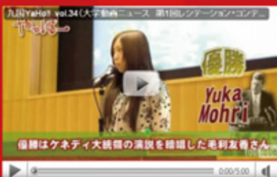
vol.34 「第 1 回 Recitation Contest」 (平成 21 年 12 月 21 日配信)

2010 年の新企画「部活の KIU-Pit (キュービット)」このコーナーでは、大学の各種サークルを紹介。今後、サークル CM やショートフィルム制作にも挑戦してみたいと思います。第一弾のサークルは、今年から新たに設立された ESS。英語好きの 1 年生が立ち上げた、エネルギーッシュなサークルの PR ムービーです。