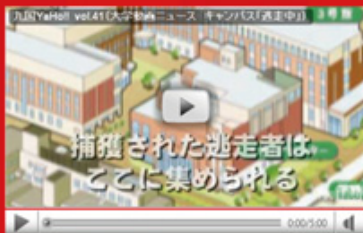
vol.41 「学生企画・キャンパス逃走中！」 (平成 22 年 5 月 10 日配信)

平成 22 年 5 月 5 日に春日公園球場で開催された「九州六大学野球」春季リーグ戦・応援合戦。今年の応援団は、四協団体、吹奏楽部、チアリーディング&野球部応援団の混合編成で、150 名の応援団がスタンドを揺らし、選手に声援を送りました。気になる試合結果は...どうぞ最後までご覧ください。