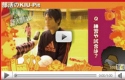
vol.37 「部活の KIU-Pit フットサル同好会編」 (平成 22 年 2 月 16 日配信)

平成 22 年 3 月 21 日に執り行われた「九州国際大学卒業証書・学位記授与式」。4 年間の思い出が詰まった学び舎から巣立つ五百数十名の九国大卒業生たち。今後さまざまな分野で彼らの活躍が期待されます。