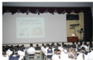
英語スピーチコンテストの様様