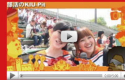
vol.43 「部活の KIU-Pit チアリーディング部編」 (平成 22 年 5 月 31 日配信)