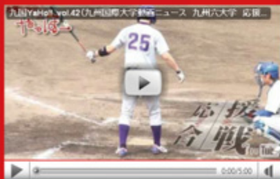
vol.42 「応援合戦」 2010 春季九州六大学野球 (平成 22 年 5 月 25 日配信)

「部活の KIU-Pit」第 2 弾は、日々、真面目に練習に取り組む「フットサル同好会」。フットサル同好会は、女子メンバーも混じってボールを追い回しています。