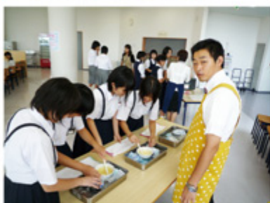
↑体験授業の様子(中段)化学「液体窒素!冷凍バナナでクギが打てるかな?」(下段)家庭「九国増城場?生キャラメル作りに挑戦」