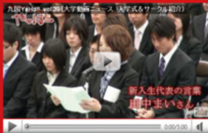
vol.39 「平成 22 年度 入学式&サークル紹介」 (平成 22 年 4 月 14 日配信)

国際関係学部が開催した「第 1 回 Recitation Contest」。「英語が大好きです！」と豪語する 10 名の発表者は、身ぶり手ぶりをまじえ、リンカーン元大統領、ケネディ元大統領、オバマ大統領など、歴代大統領の演説を朗唱しました。豊かな表現力とリアルな発音に会場は拍手で沸きました。