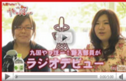
vol.44 「新入部員ラジオ出演 番宣編」 (平成 22 年 6 月 9 日配信)