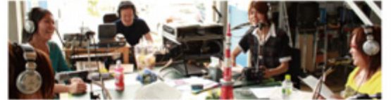
6月某日、九州国際大学大学生がパーソナリティーをつとめた1時間のFMラジオ番組「ダイ・ラジ」。放送中のスタジオの様子。