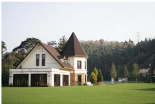
緑に囲まれた宗像市グローバルアリーナ。新入生はここで2泊3日の新入生研修を過ごす。