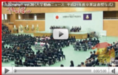
vol.38 「平成 21 年度 卒業証書・学位記授与式」 (平成 22 年 4 月 1 日配信)

4 月 5 日に執り行われた「入学式&サークル紹介」フレッシュな 600 名部の新入生たちは、やや緊張の面持ちで式に参列。入学式終了後はサークルによるさまざまなパフォーマンスが壇上で繰り広げられました。