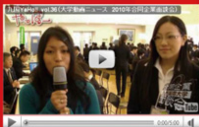
vol.36 「2010 年 学内合同企業面談会」 (平成 22 年 2 月 9 日配信)

今年 2 月 3・4 日に開催された「学内合同企業面談会」超・就職氷河期といわれる 2010 年就職採用状況の中、九州国際大学内には 1 日に 50 社もの企業人事担当者の方々が大学面談会に参加してくださいました。静かな闘志を秘めて、熱い火花を散らせる九国大生たちの就職面談会をぜひご覧ください。