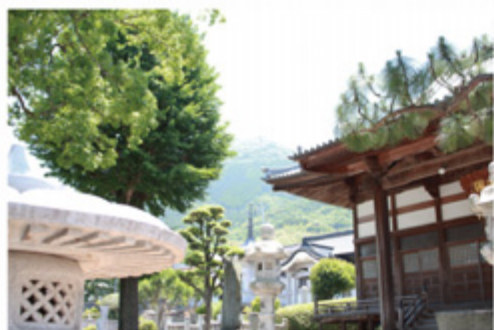
龍潜寺境内から眺める皿倉山

1901年11月18日、作業開始式を挙げた官営八幡製鐵所には、13名のお雇い外国人が在籍していた（計19名）。わが国はじめての鉄鋼一貫製鐵所を建設することは、一大国家プロジェクトであった。工場建設・操業技術習得のために、モデルとしたドイツから技師・職工が招かれ、顧問技師G・トッペの年俸が192000円、主任技師が100000円、製鐵所の日本人長官の年俸が40000円で日本人技師の最高が22000円であったから破格の待遇である。彼らお雇い外国人の中で、唯一の死亡者がカールキヨラーである。1863年生まれのキヨラーは、故国に妻と4人の子供を残し37才で中小形ロール工場職工長として八幡にやつて来た。職工は、技術導入先のグーテホフヌンクヒュッテ社が仲介した。製鐵所での技術