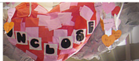
中1生製作のuncloseのハートのモニュメントが来場者を歓迎。