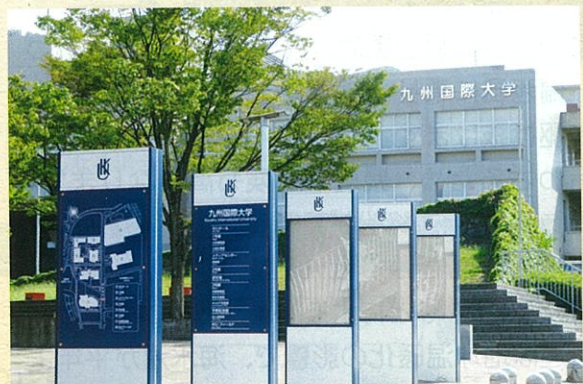
九州国際大学1号館

現在、学校法人九州国際大学は、附属高等学校・中学校を含む学園全体の新しい教育・経営ビジョンとして2024年4月から始める「第四期中期経営計画」を策定中だ。「Beyond —可能性をカタチに～そのことは学生・生徒のためになることか～」。このスローガンのもと、社会貢献、国際交流などを通じて地域から選ばれる地域NO.1の教育機関を目指す。