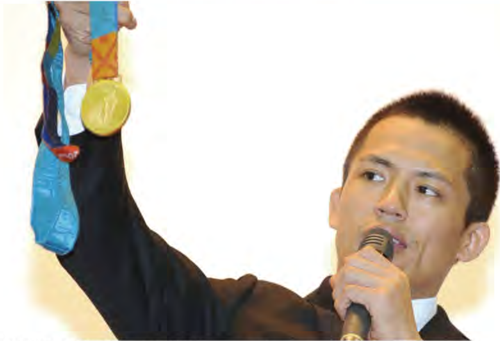
野村忠宏:アトランタ・シドニー・アテネとオリンピック史上アジア初となる3連覇の偉業を成し遂げた日本が誇る柔道家