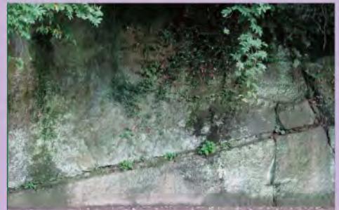
当時のノミの跡が今も残る岸壁

後に遠賀川の堀川水運は、日清戦争前後、日本の産業革命期真っ直中には、筑豊地方で掘られた石炭の輸送用水路として活躍することになり、淀川・利根川・木曾川を凌ぐ全国一の水運密度を誇った(近代化産業遺産「経済産業省認定」)。しかし、明治半ば以降、堀川の水運は運賃とスピードに勝る鉄道に譲ることとなる。