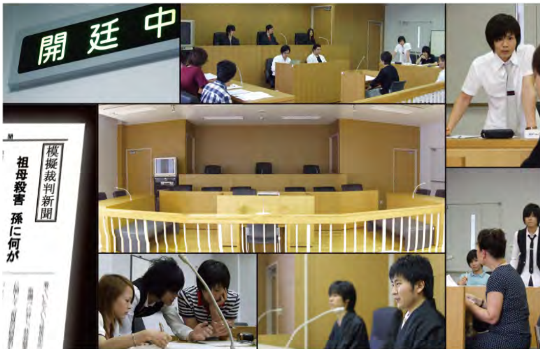
写真はすべて大学の法廷教室です