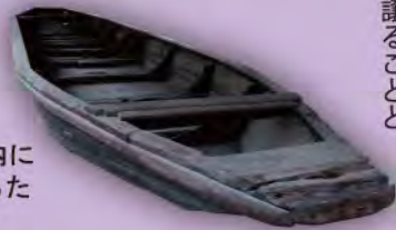
県立折尾高校内に 現存する川ひらた

折尾の街をかたちづくり、暮らす人々のシンボルともいえる遠賀川の堀川と折尾駅舎。堀川は、江戸時代(1621年)、遠賀川の洪水被害を食い止めるため、福岡藩の指揮で多くの人々が幾多の困難を克服して完成させた貴重な水路。183年もの年月を重ね、1804年に現水路が完成し、川ひらた(写真左下)の通行が開始された。その後、川底が立体交差する「伏越」は解体されて消え去ったが、18世紀半ばの車返ノミ跡は、工事の苦闘ぶりを今に伝えている(写真右下)。