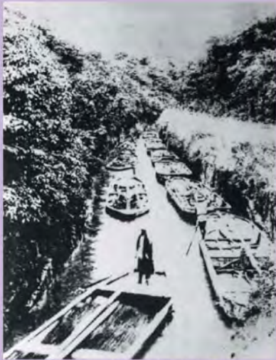
川ひらたでにぎわう堀川の風景