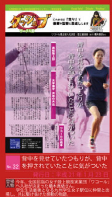
背中を見せていたつもりが、背中を押されていたことに気がついた 発行日：平成21年1月23日