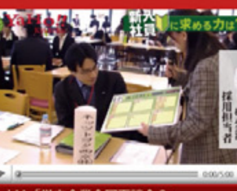
vol.11 「学内企業合同面談会2」 (平成21年2月24日から配信スタート)