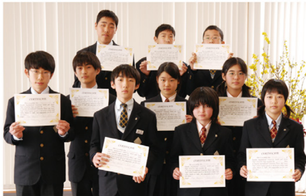
世界に羽ばたく付属中学生の登竜門。

三学期に入ってから季節にふさわしい学年・学校行事がいくつかわか開催されました。 まず1月24日（土）の百人一首大会。中学生全員で伝統の雅遊を楽しみました。競技の後には保護者の用意してくださった熱い豚汁が待っていました。 ついで29、31日にかけて二年生がスキー教室（庄原市）へ。みんなチャレンジ精神を忘れずによく頑張り、少しは上達したようです。 そして3月14日（土）、一年間を締めくくると第14回スピーチコンテスト本選大会（於、校光校舎食堂）が行われました。 開校以来、言語力（言語行動力・言語生活力）の育成を重視し、教育活動の柱の一つに据えている本校では、優秀なネイティブ教員による少人数制のきめ細やかな英会話の授業を実施しています。本行事はその成果の一端を示す大切な行事です。各学年に出された課題は次のとおり。