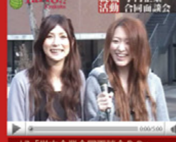
vol.7 「学内企業合同面談会PR」 (平成21年1月28日から配信スタート)