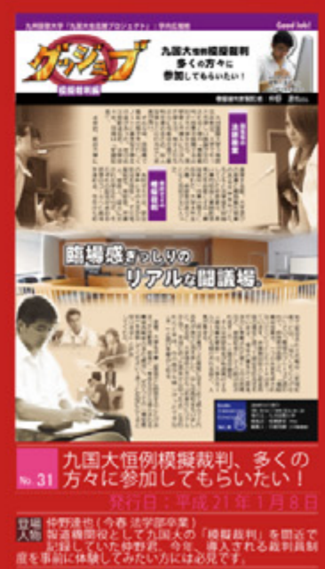
九国大恒例模擬裁判、多くの皆さんに参加してもらいたい! 発行日：平成21年1月8日