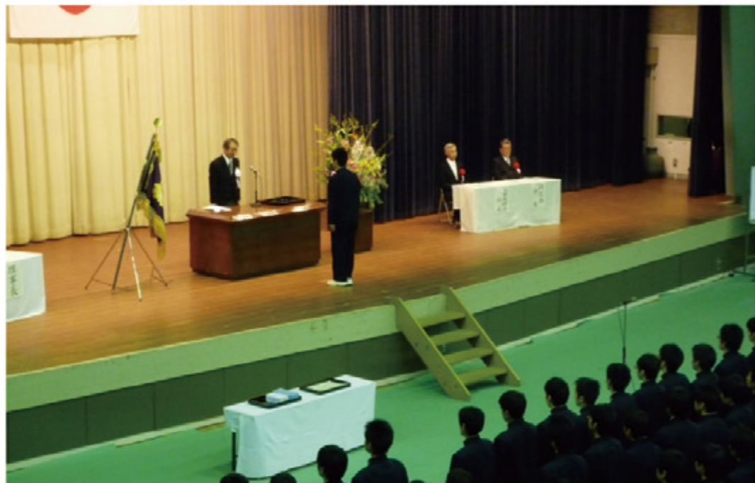
590名が新たなページをめくる！