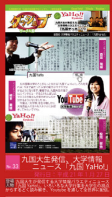
九州大生発信、大学情報 ニュース「九国 YaHo!」 発行日：平成21年1月27日

学校法人九州国際大学では、「頑張っている学生・生徒・卒業生」の応援企画として、学内広報紙「グッジョブ!」を作成しています。週1回のペースで発行される「グッジョブ!」は学園内の掲示板や大学ブログにも紹介されていますので、ぜひ一度ご覧ください。