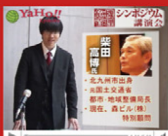
vol.6 「危機管理シンポジウム講演会」 (平成21年11月19日から配信スタート)