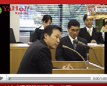
vol.10 「模擬裁判授業・公開」 (平成21年2月16日から配信スタート)