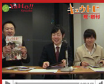
vol.3 「学園広報誌「キュウトビ」創刊」 (平成21年1月5日から配信スタート)

九州国際大学では、九国大生が企画して動画サイト「九国 YaHo! (ヤッホー)」を毎週月曜日に配信しています。九国大生がキャスター、レポーター役に扮し、さまざまな大学行事を大学生の視点でお伝えするニュース番組（5分）。Youtubeからも視聴することができますので、ぜひ一度ご覧ください。