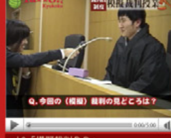
vol.8 「模擬裁判PR」 (平成21年2月2日から配信スタート)