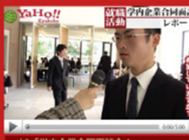
vol.9 「学内企業合同面談会1」 (平成21年2月10日から配信スタート)