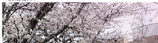
KIUホール脇の散歩道。春には美しい桜を眺めながら散歩を楽しむことができます。