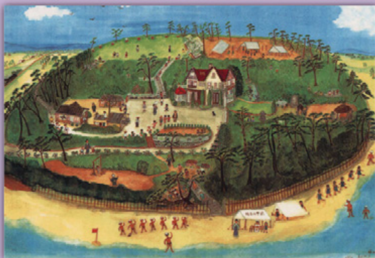
当時の櫓山荘全景（水彩画）