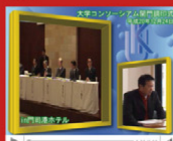
vol.5 「大学コンソーシアム開門」 (平成21年11月14日から配信スタート)