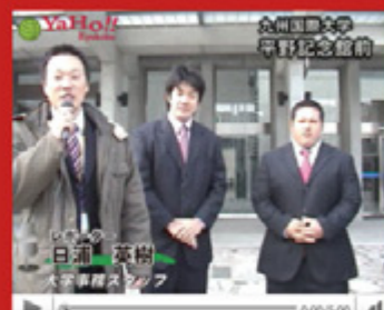
vol.2 「全日本ウエイトリフティング大会優勝」 (平成20年12月27日から配信スタート)