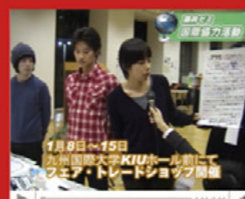
vol.4 「藤井ゼミ 国際協力活動」 (平成21年11月10日から配信スタート)