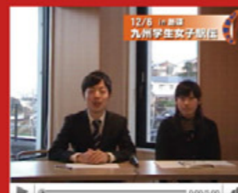
vol.1 「九州学生女子駅伝」 (平成20年12月14日から配信スタート)