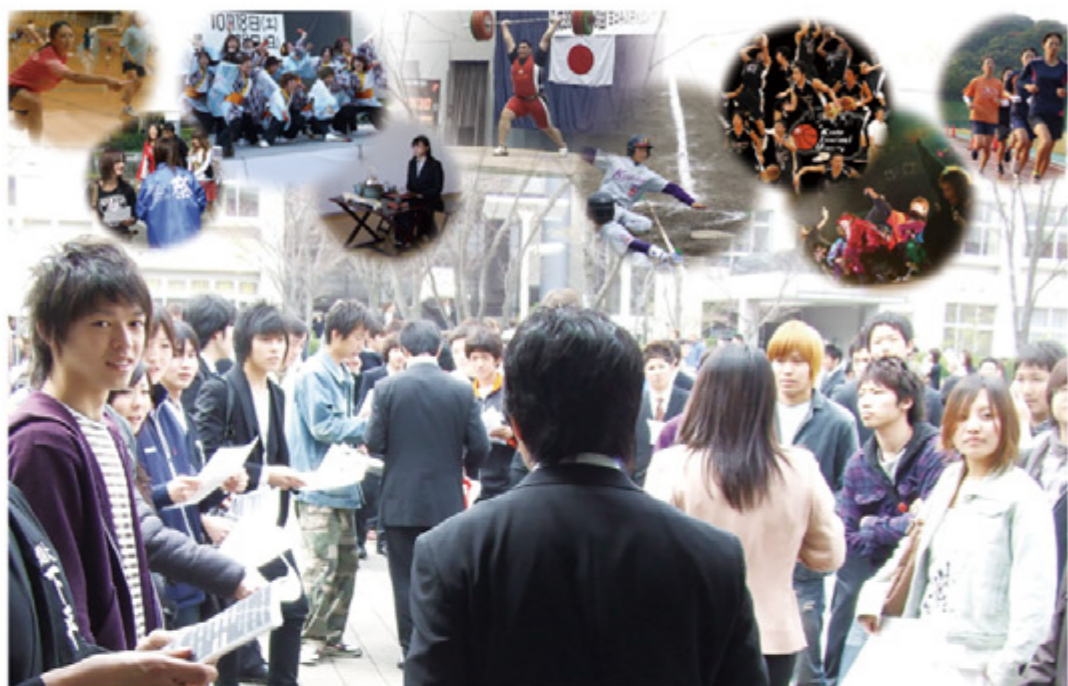
入部して見えてくる本物の大学生ライフ!