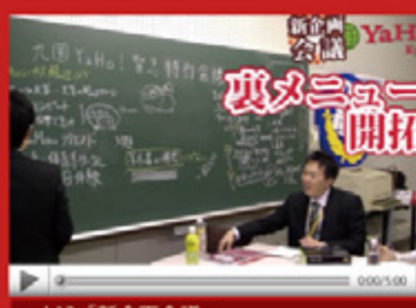
vol.12 「新企画会議」 (平成21年3月2日から配信スタート)