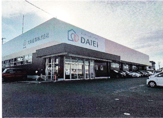
↑ 大英産業株式会社別館