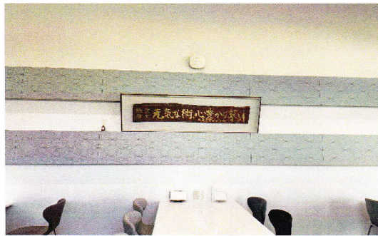
↑ 大英産業株式会社別館に飾られている社訓