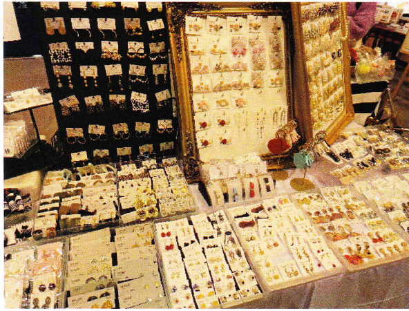
↑大英産業主催中間市でのクリスマスマーケットの様子 アクセサリーなどは個人の方々のハンドメイド作品