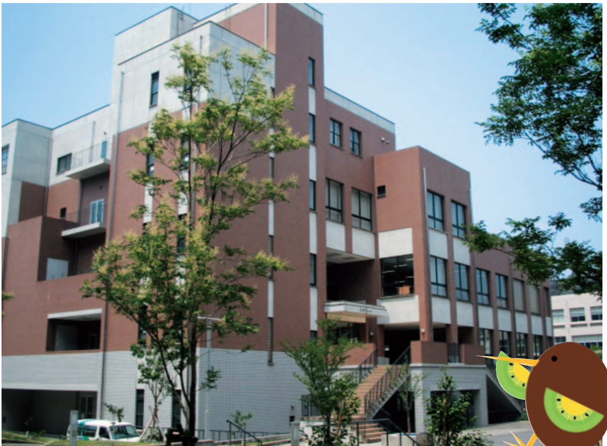
九国大図書館マスコットキャラクター KIULi (キウリ) くん