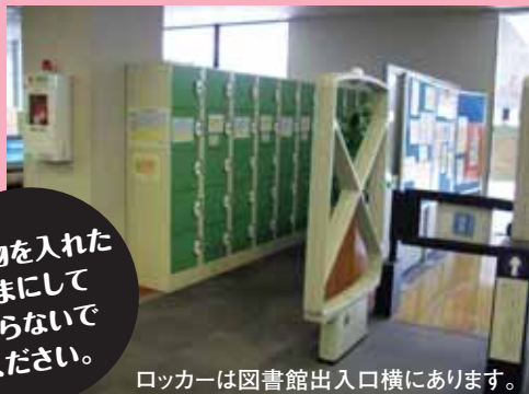
ロッカーは図書館出入口横にあります。