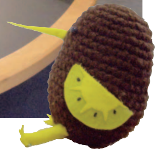
九国大図書館マスコットキャラクター KIULI (キウリ)くん